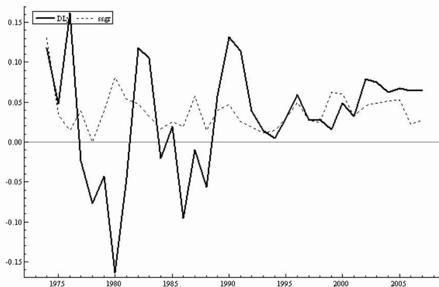
نمودار ۵-۳- نرخ رشد محصول و نرخ رشد حالت پایدار محصول ایران

در نمودار زیر نرخ رشد حالت پایدار و نرخ رشد محصول ایران با هم رسم شده‌اند.