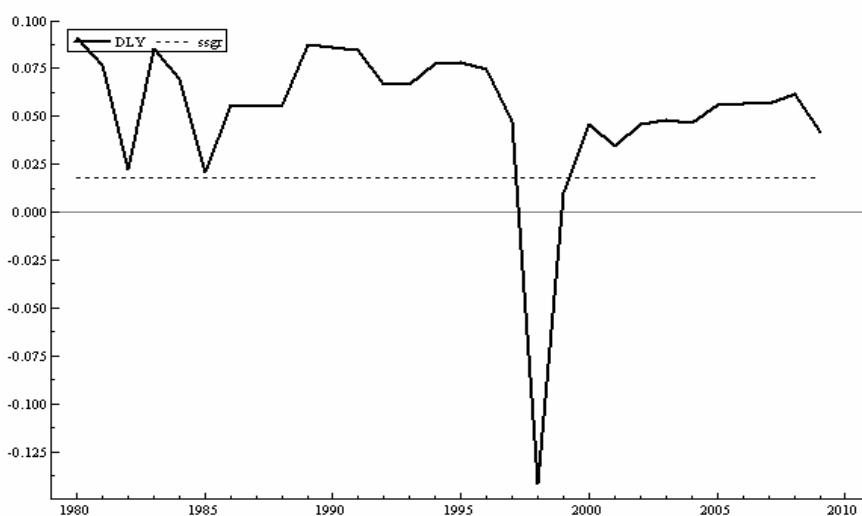
نمودار ۵-۵- نرخ رشد محصول و نرخ رشد حالت پایدار اندونزی

یادگیری از طریق انجام کار معنی دار نبودند؛ یا به عبارتی هر دو متغیر در گذر از مدل عام به خاص از الگو حذف می شوند (نتیجه تخمین در دو معادله تقریباً یکی است). باز بودن تجاری نه در کوتاه مدت و نه در بلندمدت اثری بر رشد نداشته است. نرخ رشد حالت پایدار و نرخ رشد محصول در نمودار زیر رسم شده اند. نمودار پررنگ نرخ رشد محصول را نشان می دهد و نمودار نقطه چین نرخ رشد حالت پایدار را نشان می دهد که در این حالت برابر ۱٫۸ درصد و همانند g در مدل سولو، ثابت است.